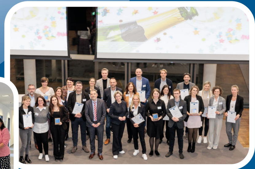
Vergabe familyNET 4.0-Award