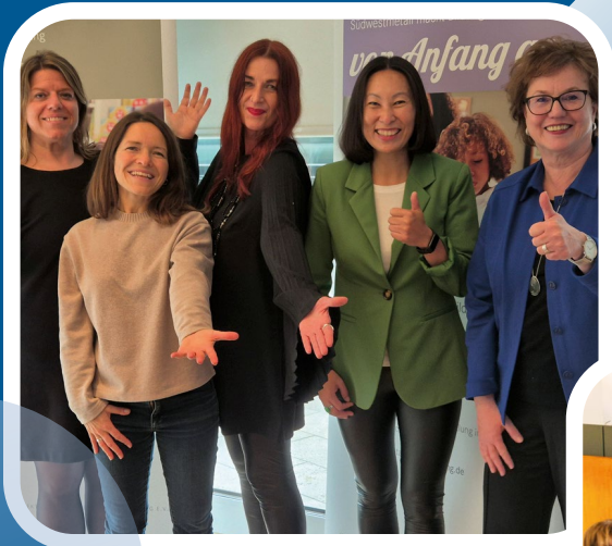
Fachtag „Frühkindliche Bildung“ der akademie 21