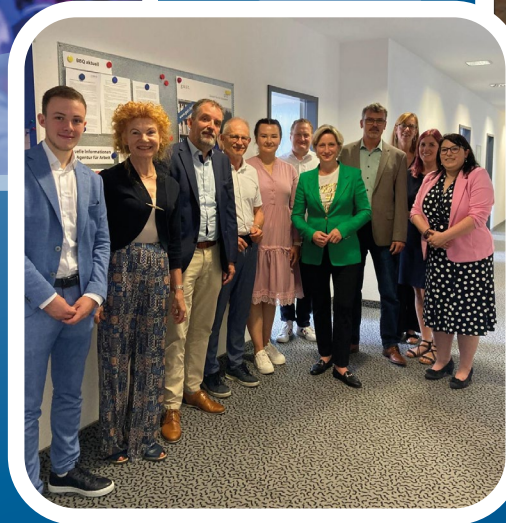
Austausch mit Ministerin Dr. Hoffmeister-Kraut zur Arbeitsmarktpolitik