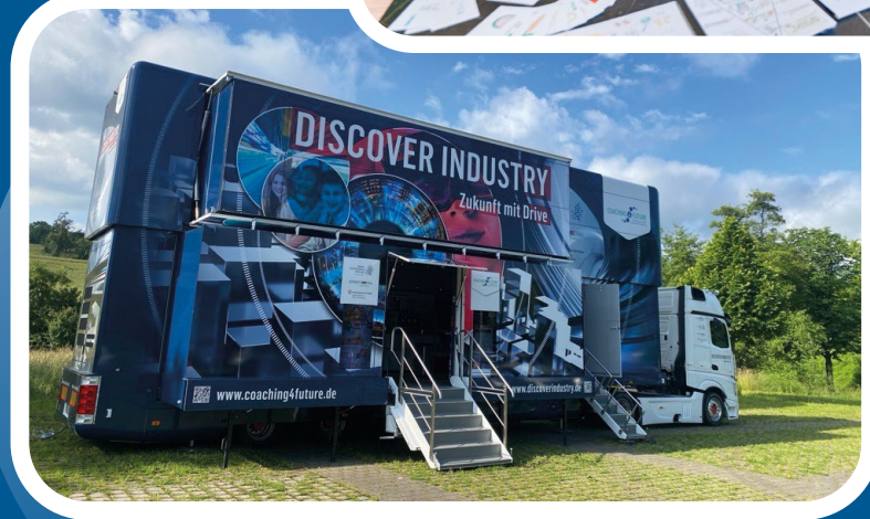
Der Erlebnistruck Discover Industry am Haus Steinheim