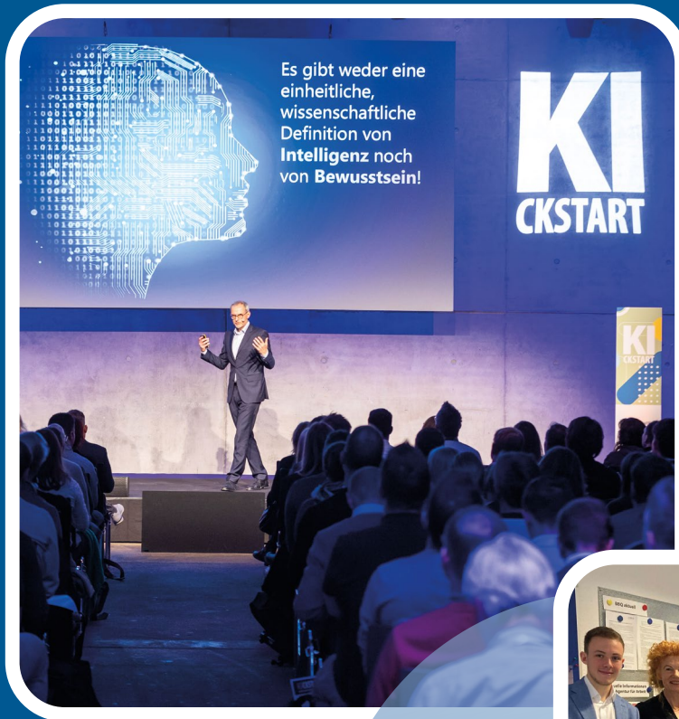
Das Gen AI Event KI.ckstart in den Wagenhallen Stuttgart

ZukunftsFest machen: Transformation erfolgreich gestalten