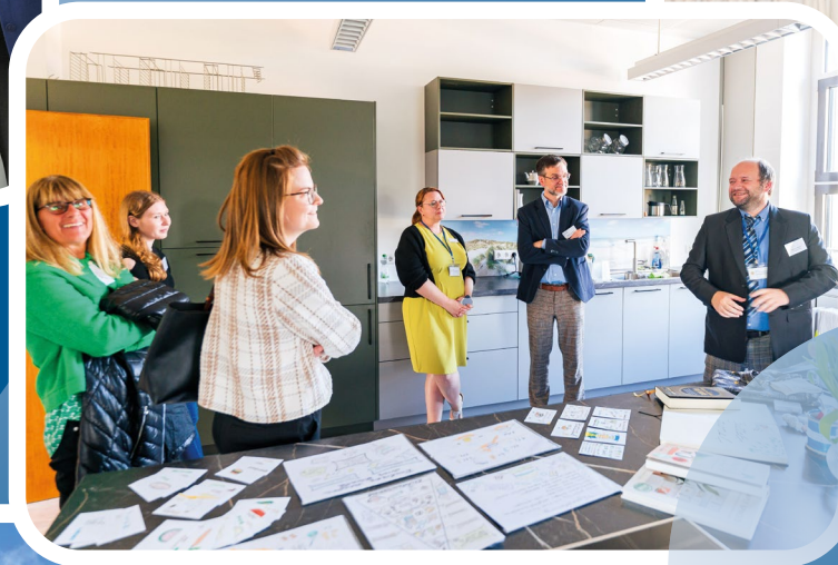
BTZ Eröffnung Offenburg