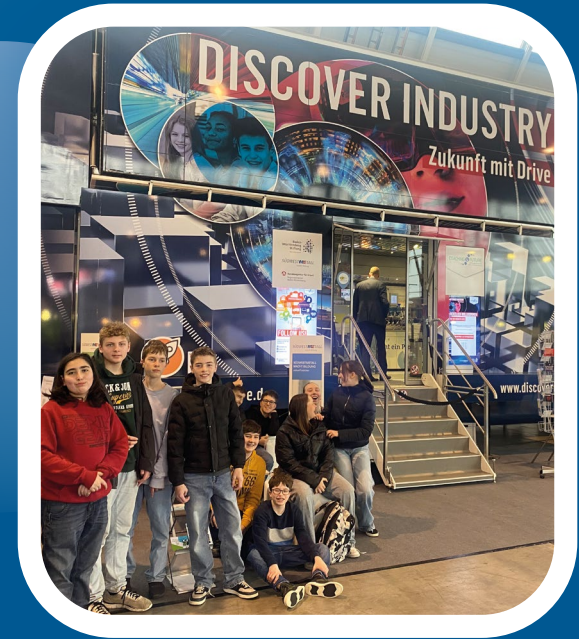
Bildungsmesse didacta in Stuttgart